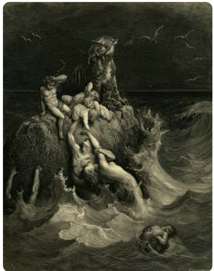
Gustave Doré - De Zondvloed

over zijn voornemen Sodom en Gomorra te verwoesten vertelt. Dat brengt Noach niet op. In de omliggende culturen zijn ook verhalen over een grote vloed verteld. Dit bewijst niet dat het verhaal historisch is, zoals sommigen willen. Het is logisch dat een catastrofale overstroming in het collectieve geheugen bleef voortleven. Hier krijgen we weer de aanduidingen uit het scheppingsverhaal, "elk dier naar zijn aard". In Gen.7:2 wordt gesproken over zeven exemplaren van elke diersoort, in vs. 9 zijn dit er ineens twee. Als je goed leest, ontdek je meer tegenstrijdigheden. De oorzaak hiervan is dat er twee verhalen samengevoegd zijn tot één verhaal met als gevolg dat er 'breuklijnen' zijn ontstaan. Is dit een fout van de rabbijnen die in Babel de Tenach in zijn huidige vorm hebben geredigeerd? Dit is mogelijk, maar volgens een andere opvatting hebben deze redactoren beide verhalen recht willen doen. Je treft dit verschijnsel ook in de Jozefverhalen aan. De fontein des afgronds werden geopend en de sluisen des hemels ook. De aarde stelde men zich voor als een platte schijf, die op zuilen rustte, die in het water stonden, een soort booreiland dus. Boven die platte schijf was de hemelkoepel aangebracht. Die men zich als van materie voorstelde. Boven die hemelkoepel was er weer water. Op de tweede scheppingsdag is die scheiding aangebracht, nu wordt die weer ongedaan gemaakt. Zo komt nu het water van twee kanten.