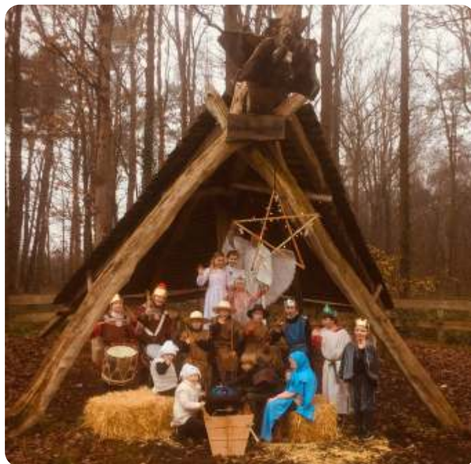
Scène uit het kerstspel