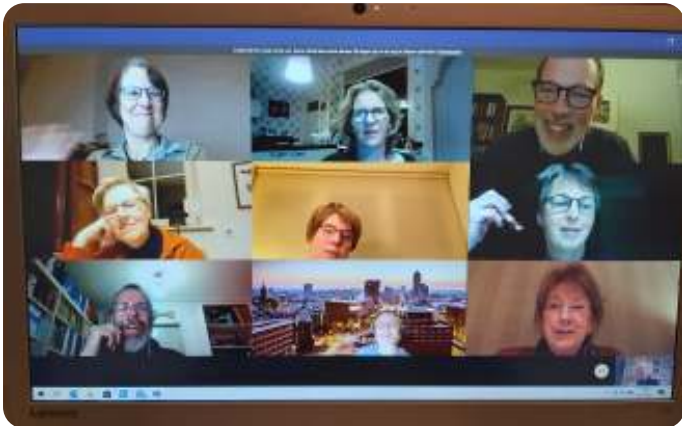
Vergaderen via internet

kunnen we helaas nog steeds alleen digitaal de kerkdienst verzorgen. Alle leden van de Kerkenraad zijn unaniem blij met de kwaliteit van de kerkdiensten, en het streamen gaat goed. Op zondag 3 januari j.l. was er tijdens de uitzending van onze kerkdienst een storing bij onze provider. Oorzaak was dat er op die datum erg veel nieuwe abonnees zich bij de provider hadden aangemeld. De kijkcijfers zijn erg goed voor onze kerk, niet alleen bij de kerkdiensten maar ook bij de uitvaarten. Het aantal vrijwilligers om deze streaming te continueren is erg klein, te klein. Men is nu ook op zoek naar uitbreiding van dit team. Meer nieuws hierover ziet u in een afzonderlijk artikel in de Drieklank. We gaan op zoek naar uitbreiding van de kerkenraad. Dit omdat er op het eind van het jaar 2 leden afscheid nemen als ouderling. In het kader van de beroepingprocedure voor een nieuwe predikant zijn we onlangs weer met de beide moderamen bij elkaar geweest. We zijn nu druk bezig om de meerjarenbegroting op orde te krijgen.