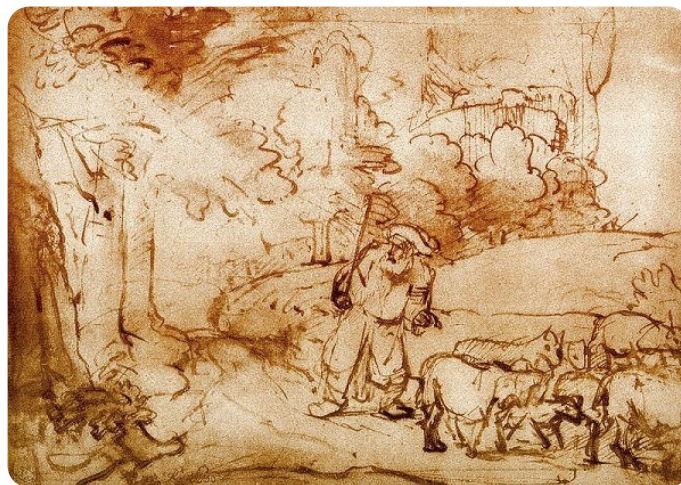
Rembrandt van Rijn: Mozes bij het brandend braambos