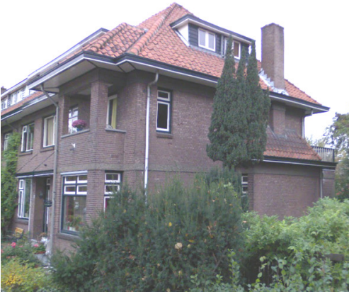
Het statige hoekpand

Ik werd opengedaan door een heer van middelbare leeftijd, en werd naar de voorkamer genodigd. Die bood vrij uitzicht op een achter de straat gelegen grote vijver, met daarachter een park. Slechts in de verte was er bebouwing te zien.