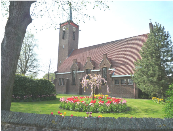
Protestantse kerk van Schore