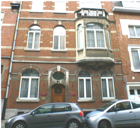
Het gebouw van de Faculteit voor Protestantse Godgeleerdheid