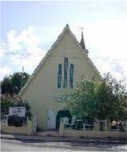
De Ebenezer Church in Willemstad

Deze Ebenezer Church maakt deel uit van de Verenigde Protestantse Gemeente van Curaçao.