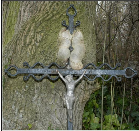
Kruis in boom

Maar mensen die geen kinderen hebben, worden veel harder geconfronteerd met dat er niemand is die zich hen herinnert, en