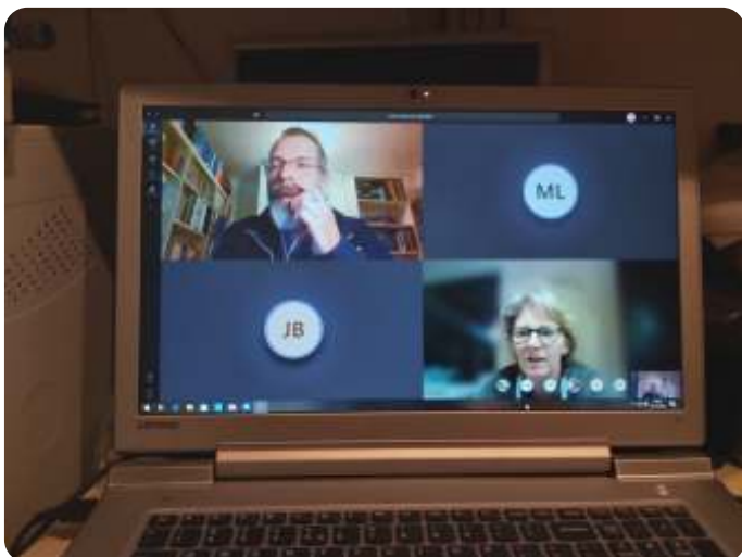
Kerkenraadsvergadering anno 2020

We hebben slechts een klein aantal van de gemeenteleden kunnen bereiken via de telefoon om een en ander mee te delen. Wanneer u in het bezit bent van een e-mailadres, of smartphone met Whatsapp, en u wilt op de e-mailverzendlst of in een whats-appgroep van kerkgangers komen te staan om sneller geïnformeerd te worden, wilt u dat mailadres of 06-nummer dan aan ons toe mailen op het e-mailadres; p.g.usselo1@gmail.com Behalve dat het nieuws ook op de site van onze kerk www.protestantsegemeente-usselo.nl op internet zal worden gepubliceerd kunnen wij u dan ook persoonlijk zo snel mogelijk van informatie voorzien, bij voorbeeld om aan te geven wanneer we de reguliere kerkdiensten gaan hervatten. We gaan met de jeugd, die natuurlijk erg gemakkelijk met de nieuwe media om kan gaan, ook via het internet bezig om hen op die manier met de kerk verbonden te houden.