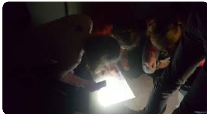
In de walvis

Sirkelslag YOUNG is een spannend en interactief spel, waar groepen jongeren het tegen elkaar opnemen. We zaten met z'n allen met beamer en scherm in het klaslokaal van het Verenigingsgebouw met veel frisdrank en chips, en speelden daar online tegen honderden andere groepen uit heel Nederland. Het thema was 'Kom in beweging' en het ging over het verhaal van Jona en de walvis. Het verhaal begon in het donker, in de vis (zie foto).