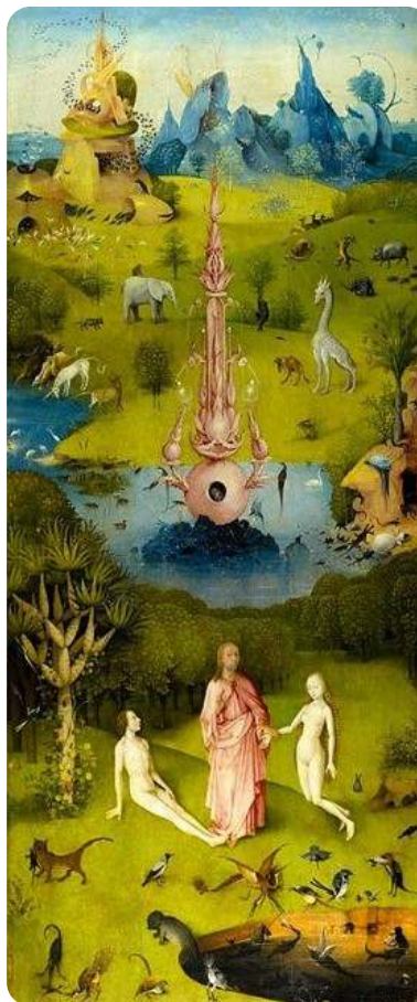
Tuin der Lusten - Jheronimus Bosch

In De tuin der lusten van Jeroen Bosch zit Adam plat op zijn gat verbaasd naar Eva te kijken, die God, hand in hand met haar, aan Adam voorstelt. Linksonder loopt een poes met een muis in haar bek weg. Een beetje vreemd natuurlijk, want dit kon nog niet in de Hof van Eden.