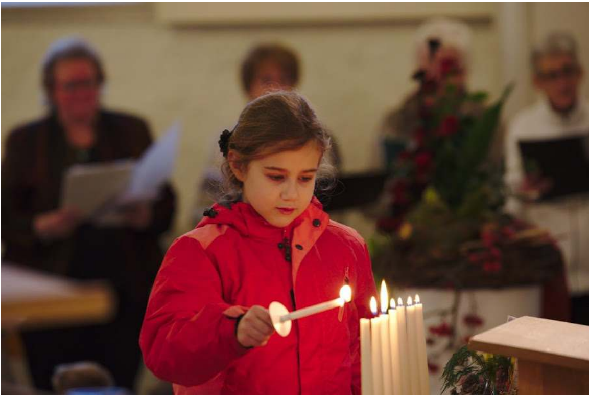
Aansteken van de kaarsen