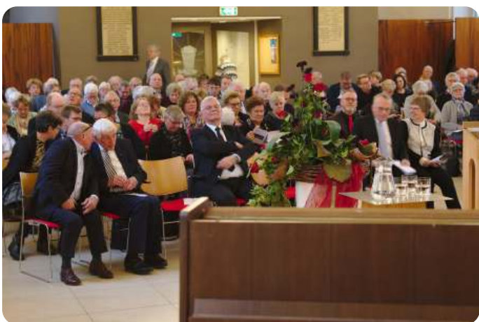
Een volle kerk