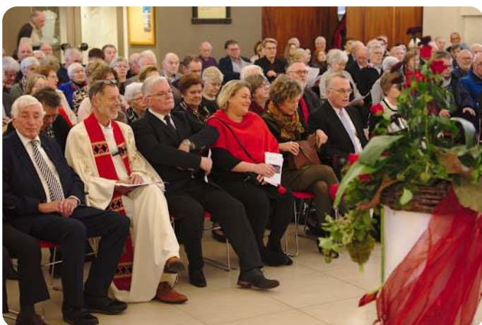
De dienst begint