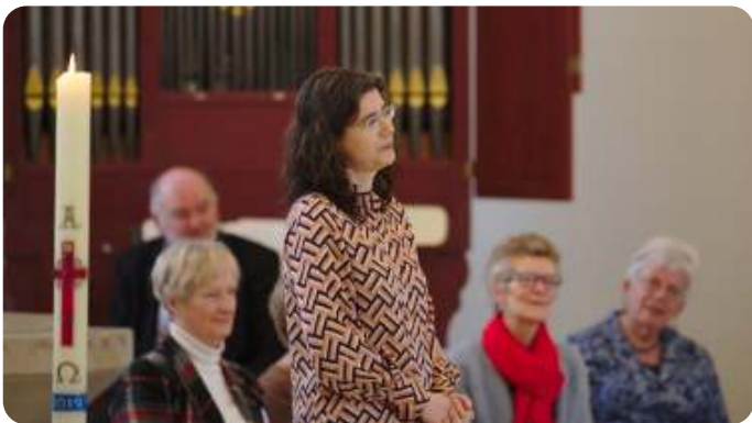
Marion in de schijnwerpers