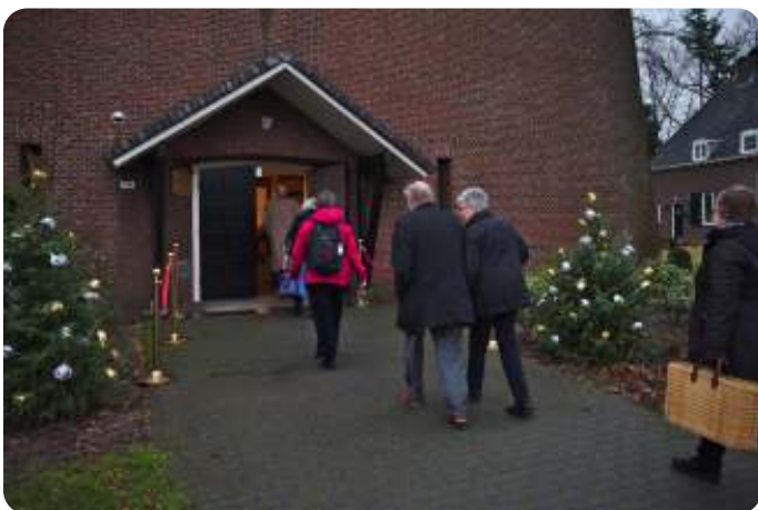
Feestelijk versierde toegang