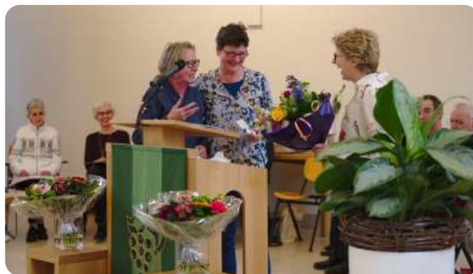
3 maatjes van de jeugdkerk