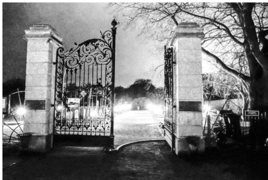
Ingang begraafplaats van Usselo

Op vrijdag 16 december a.s. zal de lichtjesavond plaats vinden op de begraafplaats van Usselo.