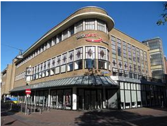
Het oude V&D-gebouw