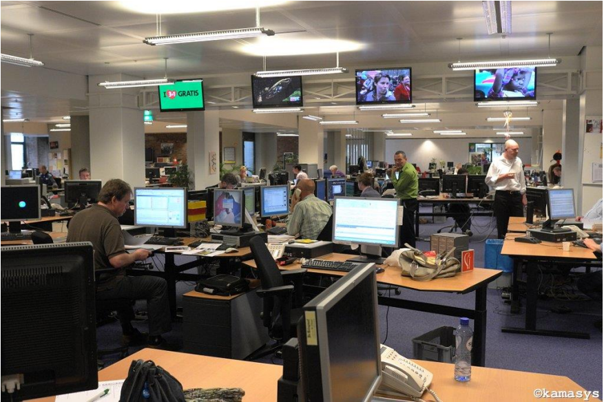
Het redactielokaal van Drieklank