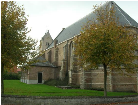
Jodocuskerk in Oosterland (Zld)

In november van dit jaar is het 40 jaar geleden dat Martin van der Meer, geboren in 1948 in 's-Gravenzande, in zijn eerste - hervormde - gemeente van Oosterland (Zeeland) in het ambt van predikant werd bevestigd.