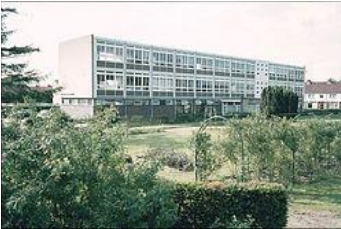
Het Rosarium, de voormalige Pedagogische Academie van Almelo

In deze periode heeft ze zich afgevraagd vanuit welke levensbeschouwing ze onderwijs zou willen geven: openbaar onderwijs, of christelijk onderwijs. Van huis uit heeft ze niet zo heel veel meegekregen van wat christelijk geloof inhoudt, en ze besloot toen om zich er meer in te verdiepen. Zo ging ze bijvoorbeeld naar catechisatie bij haar eigen predikant in Almelo. Dat was iemand die je liet kennismaken met de joodse wijze van denken en geloven. Daarnaast vond hij dat er in de kerkdienst veel aandacht besteed moest worden aan liturgie.