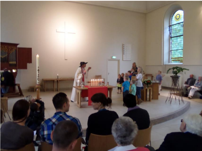
Met de kinderen van de kindernevendienst

Het eerste deel van de dienst werd dan ook geleid door ds. in 't Hout. Toen deze de bevestiging van ds. Haasnoot tot een goed einde had gebracht nam ds. Olaf Haasnoot de leiding over. Al spoedig bleek die een lichtelijk onconventionele stijl niet te schuwen. Voor de kinderen die naar de kindernevendienst gingen had hij een verrassing in petto: hij speelde een tovenaars, waarbij een echte tovenaarshoed erg overtuigend overkwam.