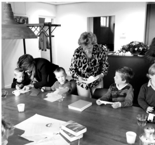
Om kennis te maken met gezinnen, maakten de kinderen afgelopen dienst bloemen om aan vluchtelingen te kunnen geven