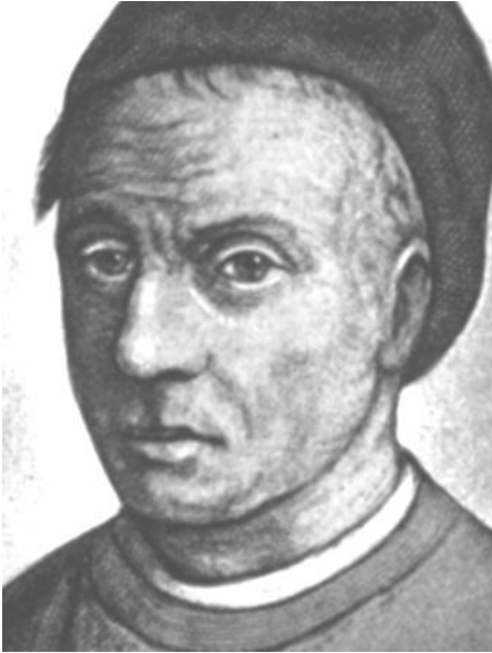
Thomas a Kempis

Het oplaadpunt, zoals bij een elektrische auto, was de eucharistie of het avondmaal. Daar ontving de mens voedsel voor het leven, brood en wijn, lichaam en bloed van Christus.